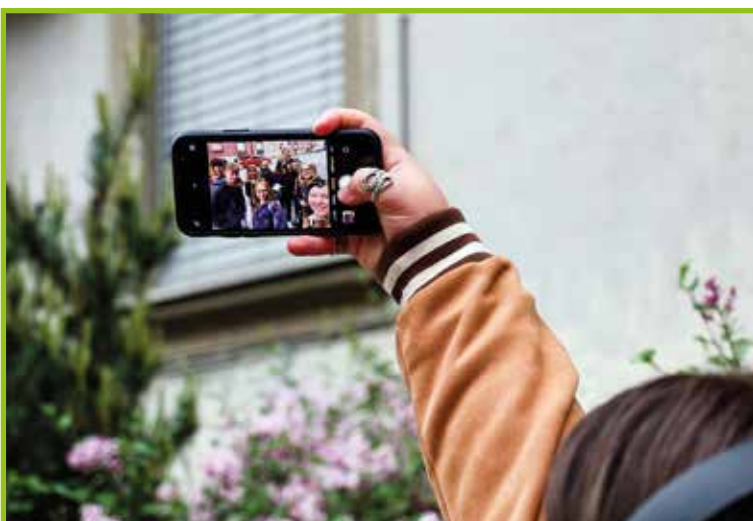
Selfi dijakov 1. letnika.