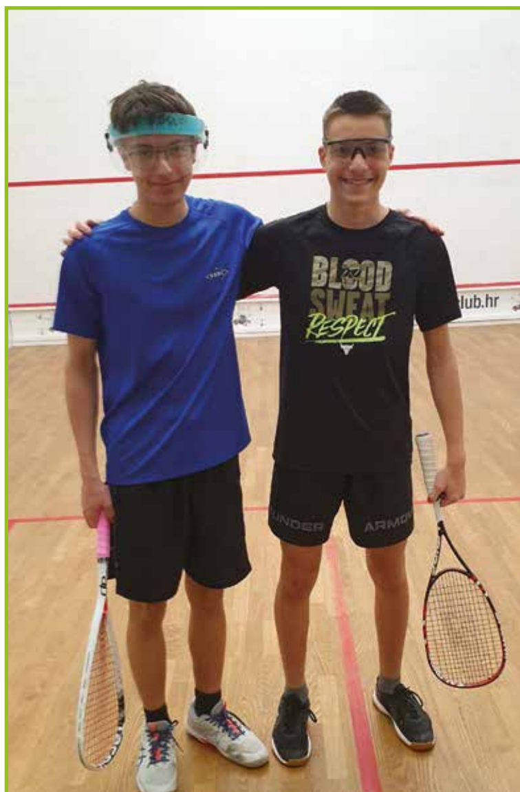
Vid baburić s soigralcem.

Ali imaš kakšnega vzornika, ki je tvoja motivacija za nadaljevanje tega športa?