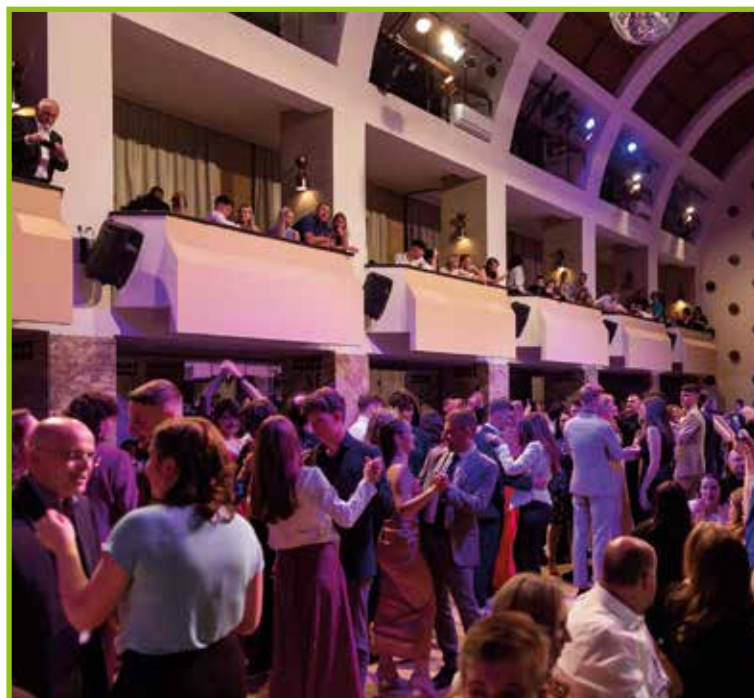
Ples z učitelji.