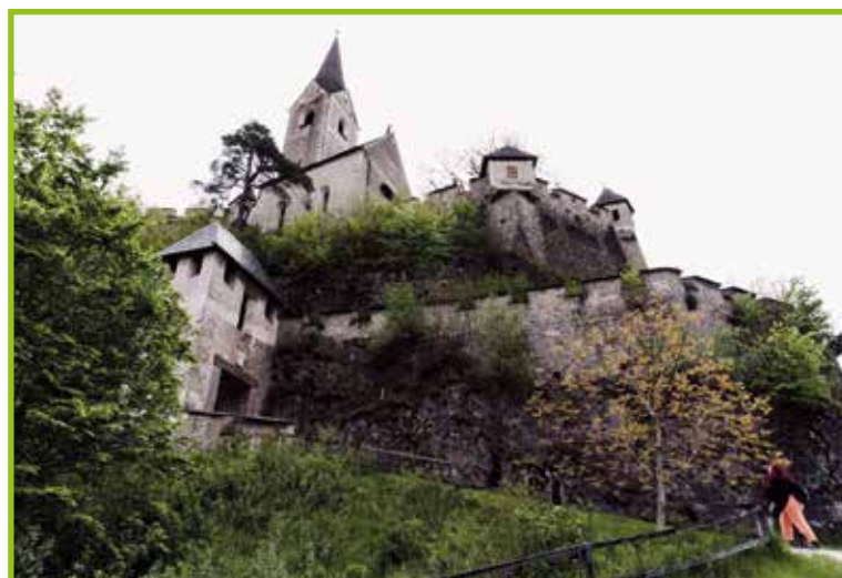
Grad Visoka Ostrovia.