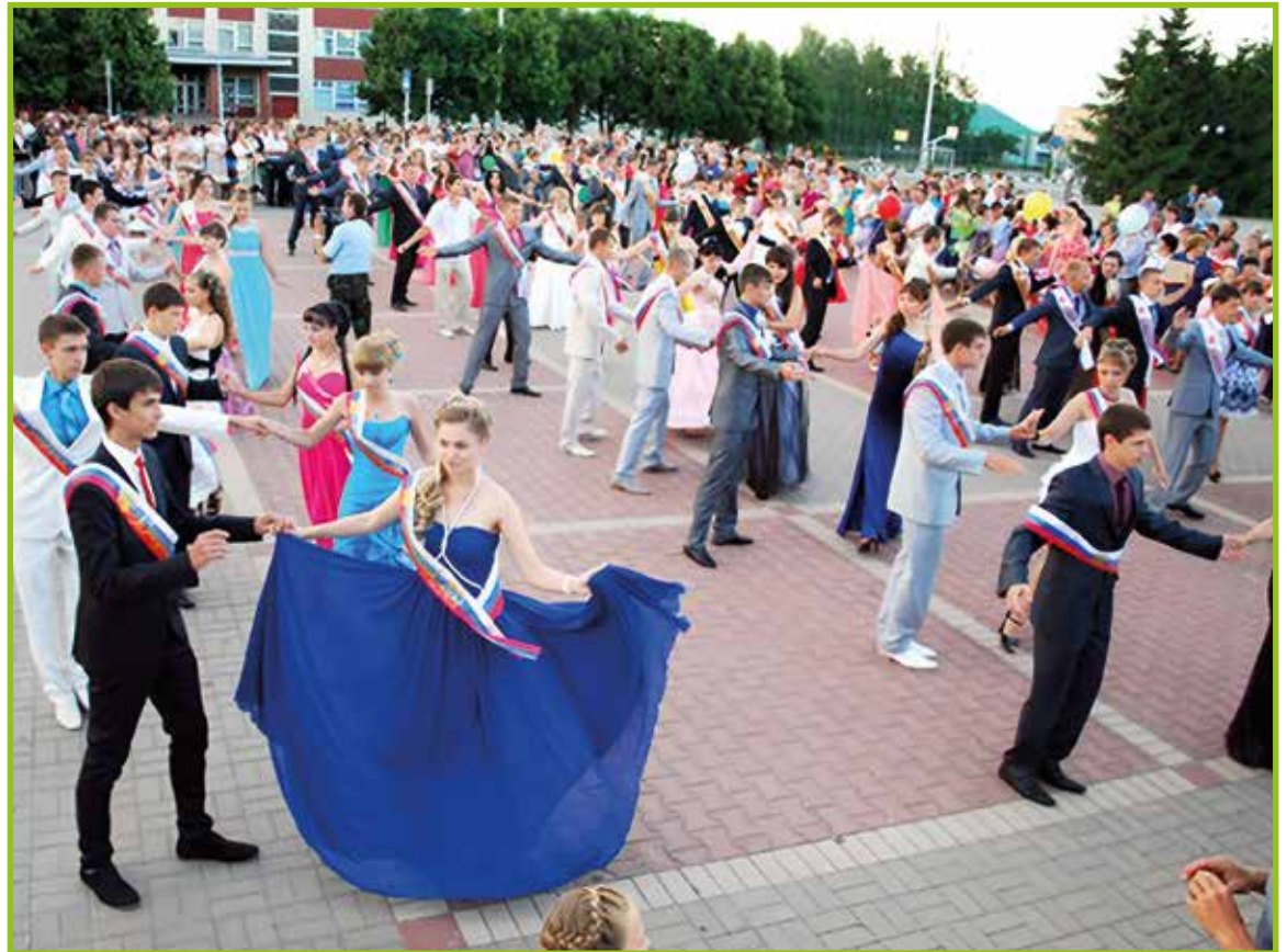
Sam ples na maturanskem plesu.