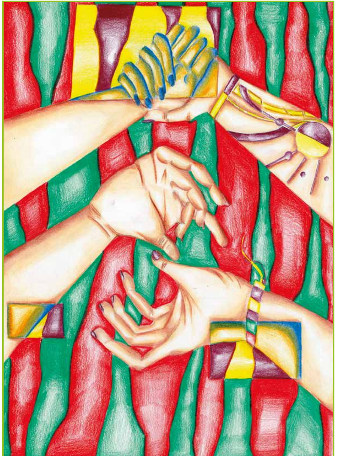
Projektna naloga pri predmetu Grafično oblikovanje.