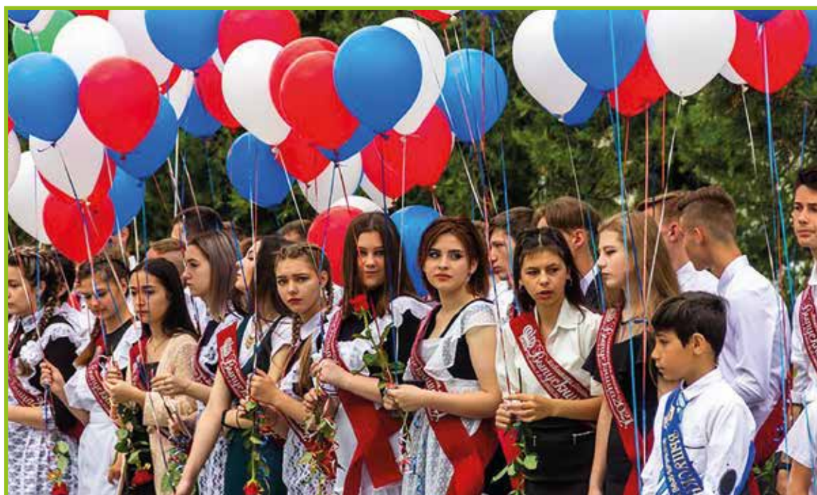
Prireditev in podelitev spričeval.