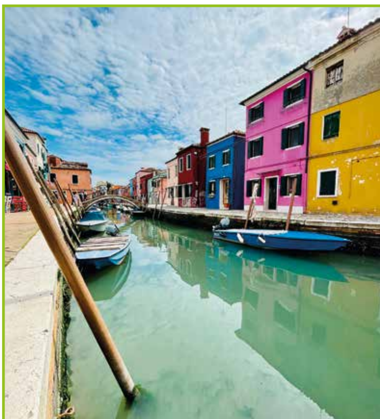
Po ulicah Burana.