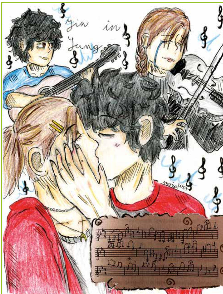
Balada o drevesu v sliki.