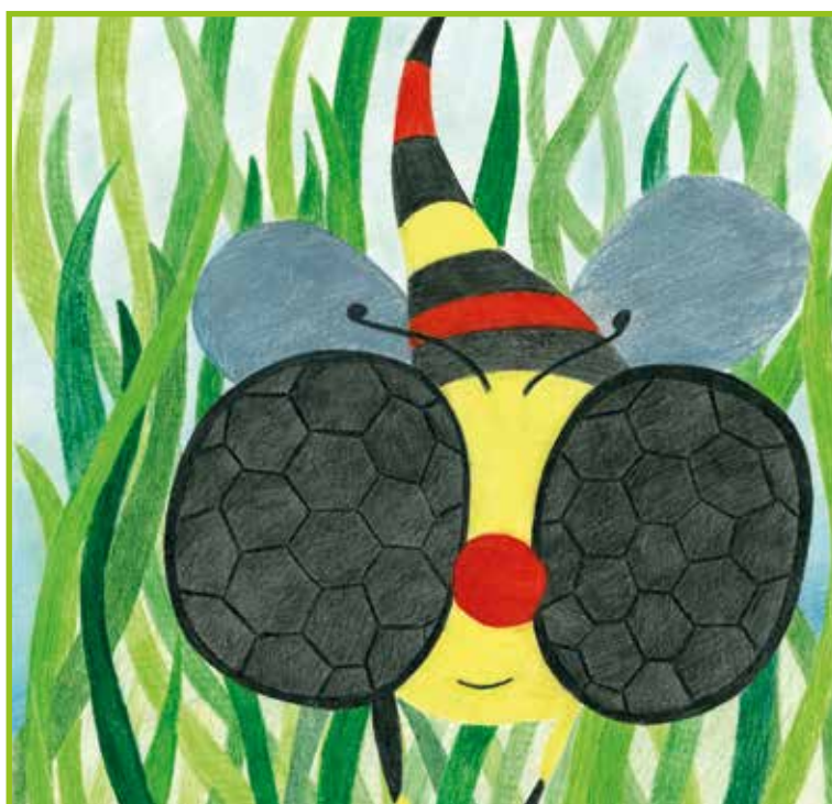
Projektne naloga pri predmetu Grafično oblikovanje.