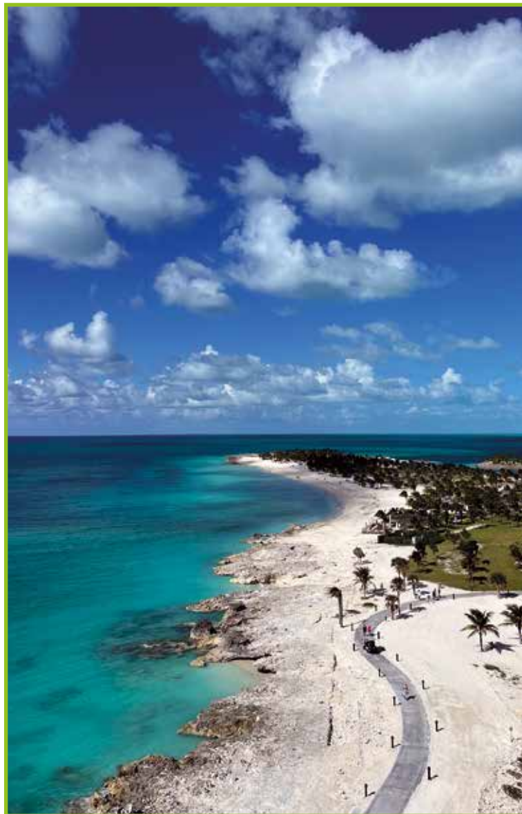
Ocean Cay – MSC Marine Reserue.

Obisk Dominikanske republike je sledil prihodnji dan, in sicer obisk mesta Puerto Plata, ki se nahaja na drugi strani otoka. Dominikanska republika, kot del karibskega otočja, je seveda znana po rumu in cigarah, katerih proizvodnjo smo si v tistem dnevu ogledali. Po kratkem sprehodu po centru mesta smo v pristem karibskem lokalnu kosili. Okusne jedi vsebujejo predvsem mleto meso in riž, nato pa smo lahko poskusili še lokalno pijačo Mama Juana. Lokalna pijača je napitek iz nekih zelišč, pridelanih v Dominikanski republiki, in ruma. Kasneje smo odšli na ogled proizvodnje cigar La Aurora. Pogledali smo si, kako rastejo rastline za pridelavo tobakovih listov in kako jih sušijo,