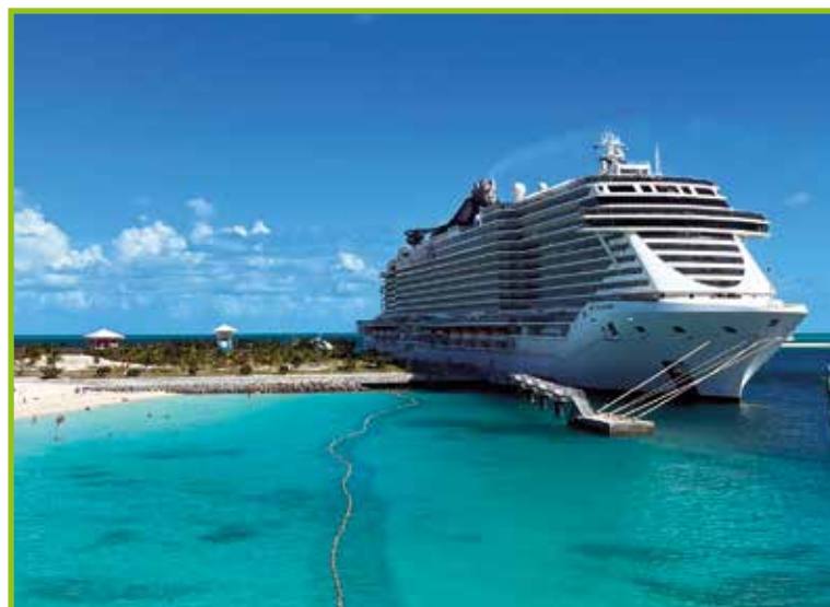
Križarka MSC Seaside.