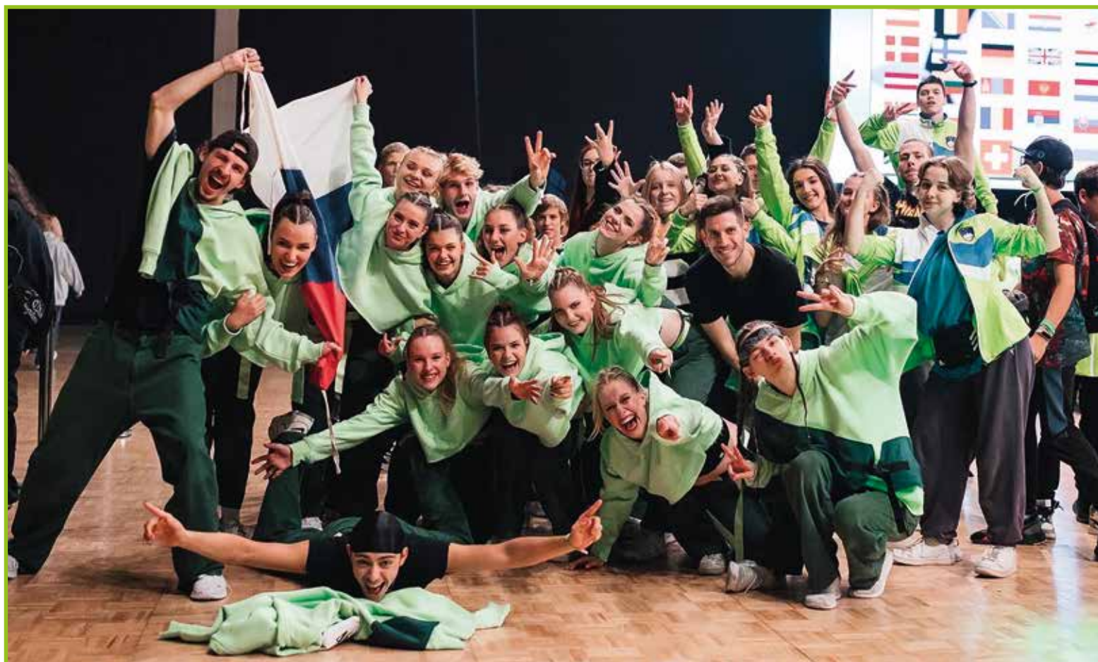
Shod vseh nastopajočih držav.

imamo enkrat mesečno tudi pokalne turnirje. Domače tekmovanje se zaključí z Državnim prvenstvom v juniju. Seveda je čudovito, če si priplešeš največji pokal, je pa odlično že, če je tvoja uvrstitev dovolj visoka, da se lahko uvrstiš na evropsko in svetovno prvenstvo. Temu sledi tisto najbolj zanimivo, potovanja. Prva pot v letu 2022 je bila v Sarajevo. Tri dni zabave na Festivalu, z najboljšimi "frendi" in najboljšimi bureki na Baščaršiji. Po štirih mesecih "švicanja" smo bili že tako dobri, da smo zmagali Gala prireditev na Inter dance festu. Festivalsko tekmovanje je