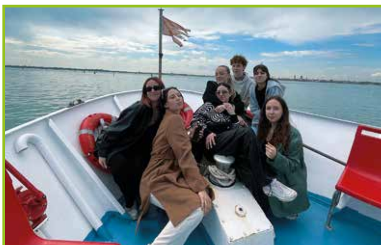
Sošolci na ladjici.