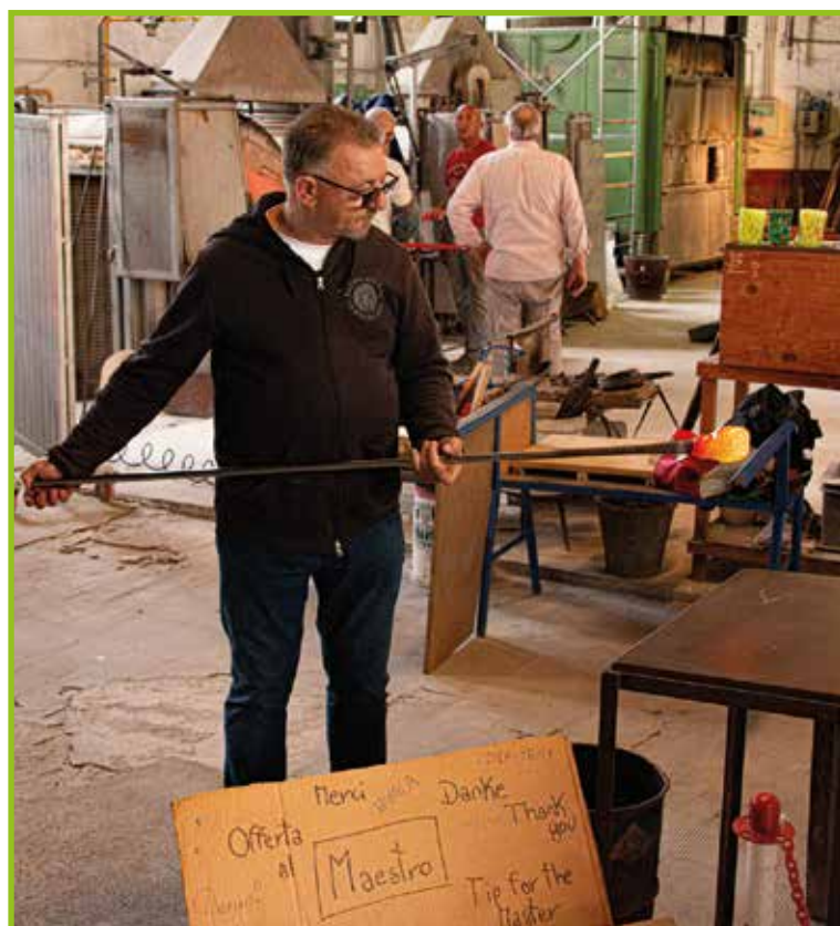
Izdelava steklenega konjička.