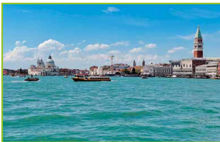
Pogled na Benetke.