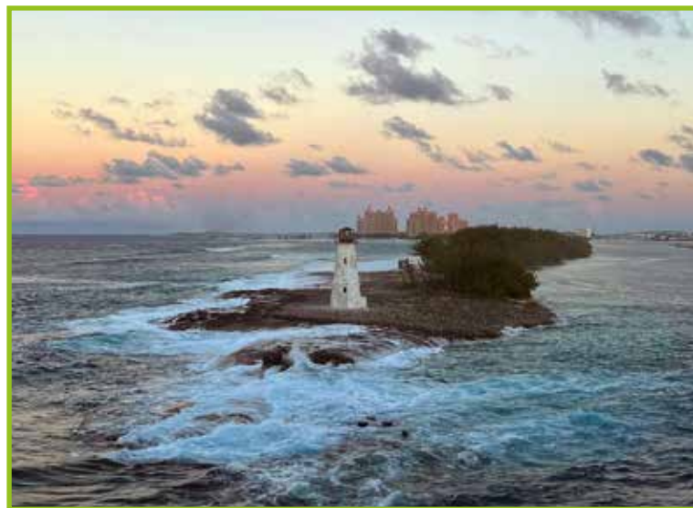
Nassau, Bahamas – glavno mesto, ki je tudi svoj otok.