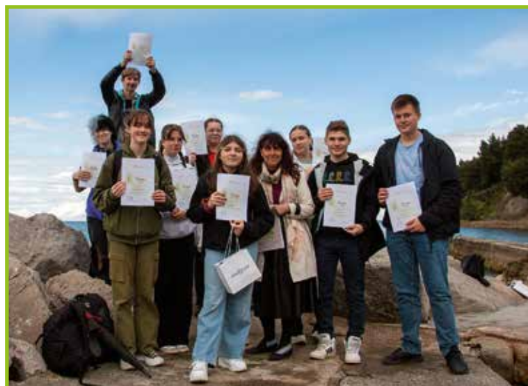
Uživanje ob morju.