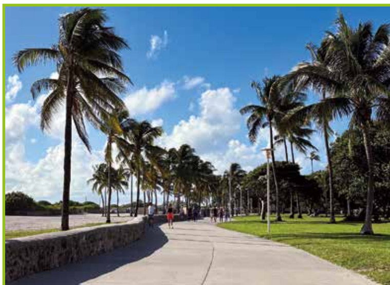
Miami Beach Florida.