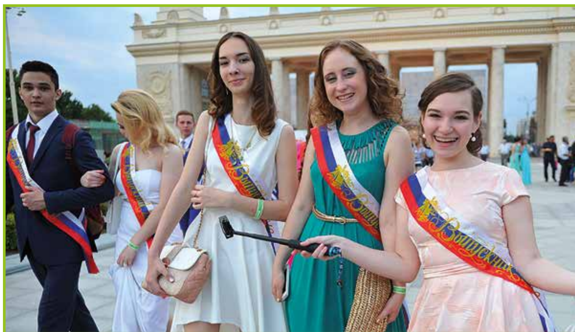
Priprava na prireditev.

Danes šolarji ne dobijo medalj, ampak obstaja medalja "Za posebne dosežke v poučevanju". To je zvezna medalja. Moskovski