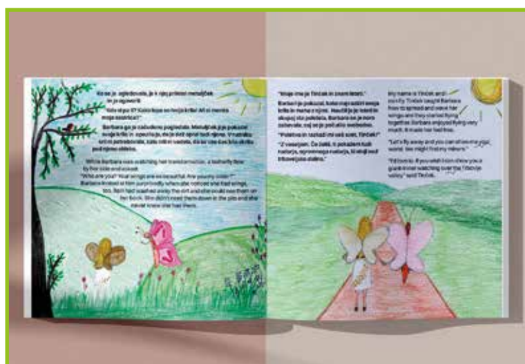
Ilustracije s suhimi barvicami.