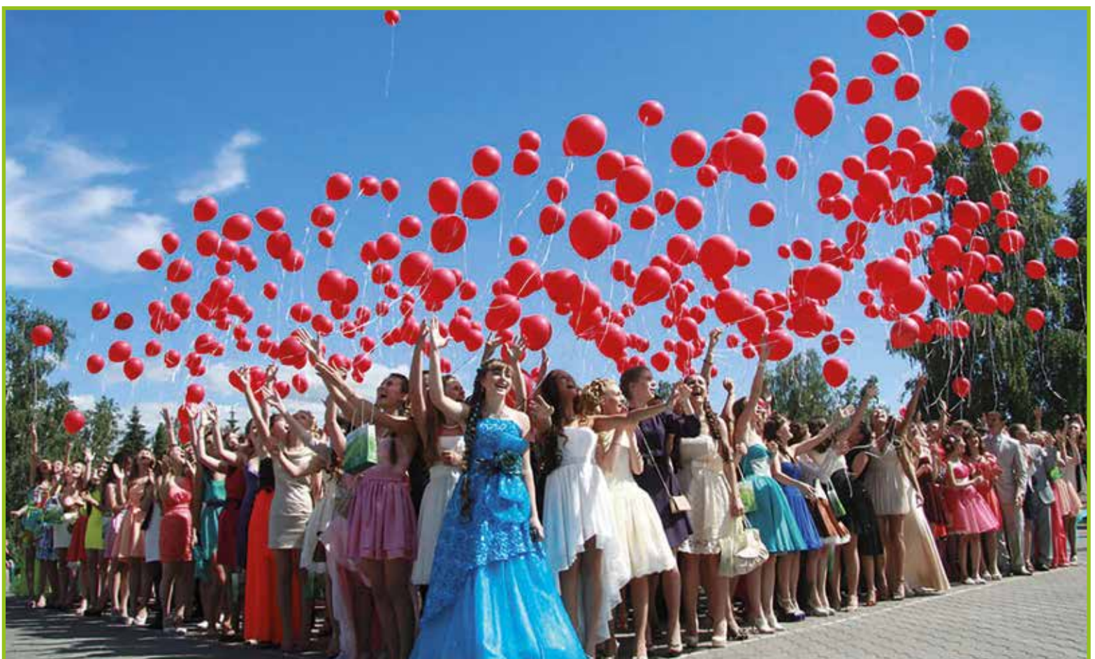
Spuščanje balonov v zrak (tradicija).